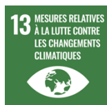
Action pour le climat (ODD 13)